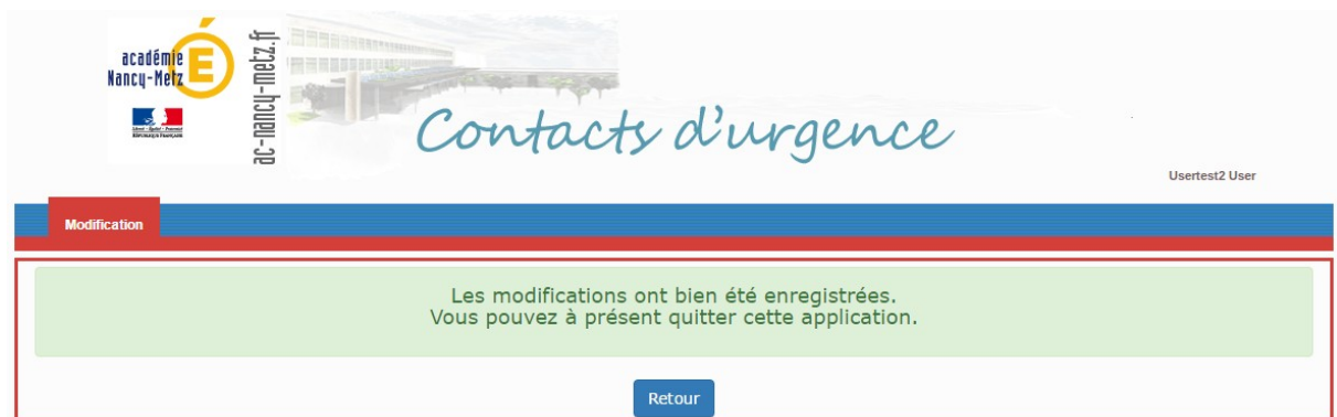
message de confirmation

Après validation de la saisie, un message de confirmation apparaît :